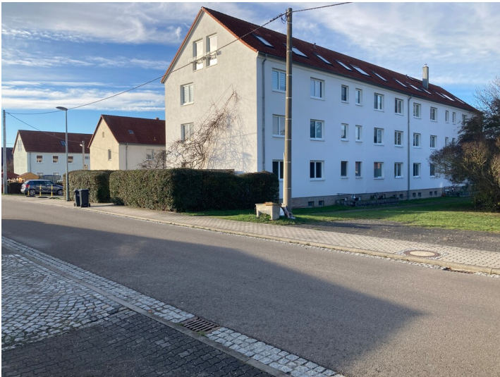
Drei Mehrfamilienhäuser, vorn der jüngste Block (Nr. 3, 3a), Blick von Südosten