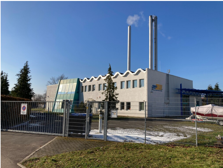
Heizkraftwerk der Siedlung Borna-Ost, Blick von Osten