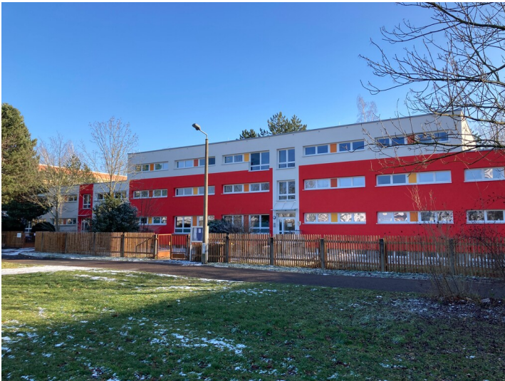
Ehemalige Kinderkombination, Blick von der davor liegenden Grünfläche im Nordwesten