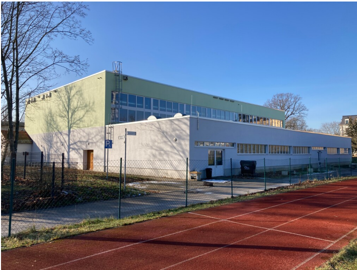
Turnhalle, einst der POS »Lenin«, Blick von Südost