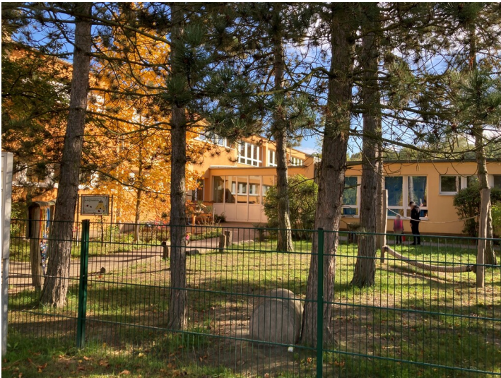
Ehemalige Kinderkrippe "Käthe Kollwitz", Blick von Nordwesten auf zweigeschossigen Haupttrakt, daneben eingeschossiger Verbindungsbau und Wirtschaftstrakt