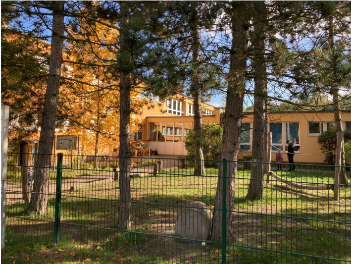
Ehemalige Kinderkrippe "Käthe Kollwitz", Blick von Nordwesten auf zweigeschossigen Haupttrakt, daneben eingeschossiger Verbindungsbau und Wirtschaftstrakt