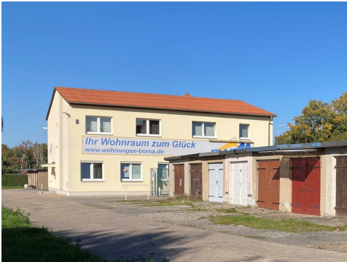
Ehemalige SB-Wäscherei, später Reparaturstützpunkt der AWG "Glück auf", Blick von der südlichen Heinrich-Böll-Straße