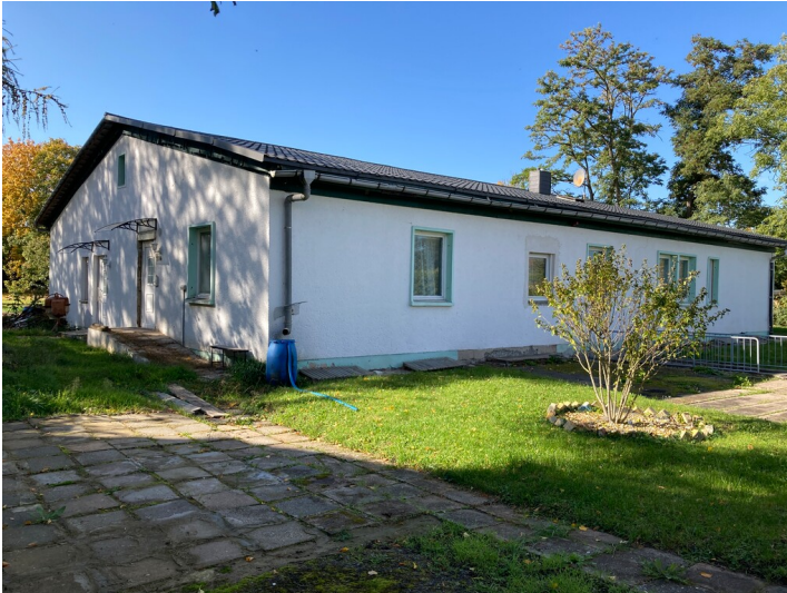
Ehemaliges AWG-Heim der Siedlung Borna-Nord, Blick von Südost