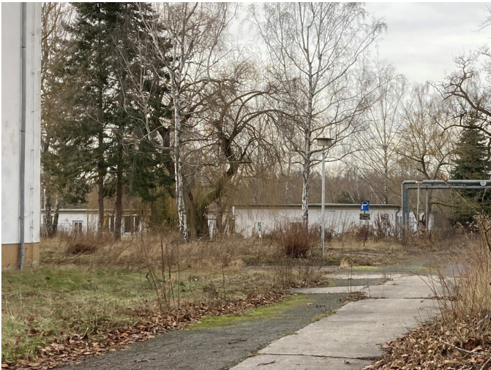
L-förmiges Nebengebäude der ehemaligen Betriebsberufsschule Großzössen, Blick vom Eingangstor im Osten