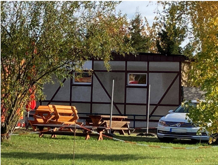
Ehemalige Garage der Tagesanlagen Espenhain in Auenhain, Blick von Norden auf die Fassade mit Scheinfachwerk