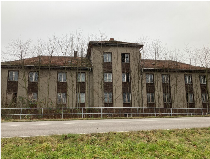
Ledigenwohnheim, Blick von Westen