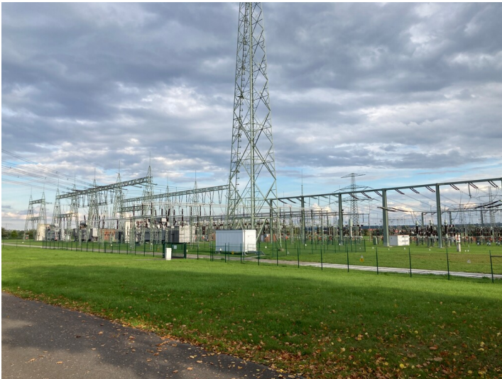
Umspannwerk mit Gleisanlage, Transformatoren und Schaltanlagen