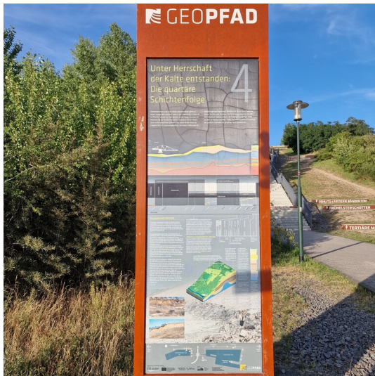
GEOFAD, Stele Nr. 4 am Auenhainer Ufer des Markkleeberger Sees, im Hintergrund begleitend eine Treppe zur Erdgeschichte