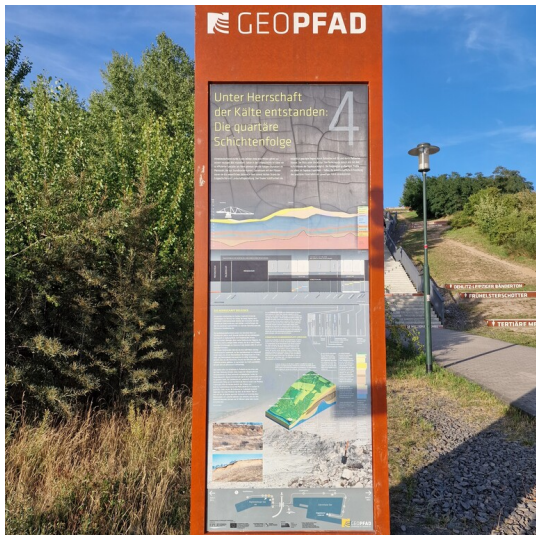
GEOPFAD, Stele Nr. 4 am Auenhainer Ufer des Markkleeberger Sees, im Hintergrund begleitend eine Treppe zur Erdgeschichte