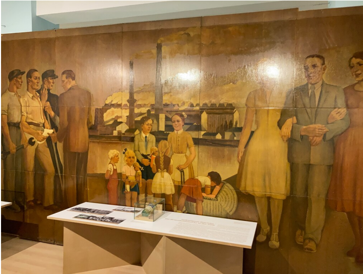
Einst Wandbild im Kulturhaus des Braunkohlenwerkes Borna, heute Teil der Dauerausstellung im Museum der Stadt Borna