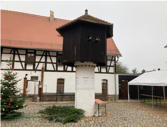
Taubenhaus, nach historischem Vorbild aus Breunsdorf, heute im Geschichtenhof Wyhra