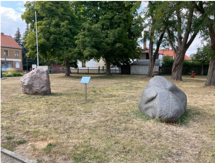
Zwei Findling mit Tafel, Blick von Südost