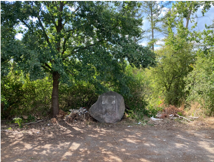
Gedenkstein, am westlichen Straßenrand