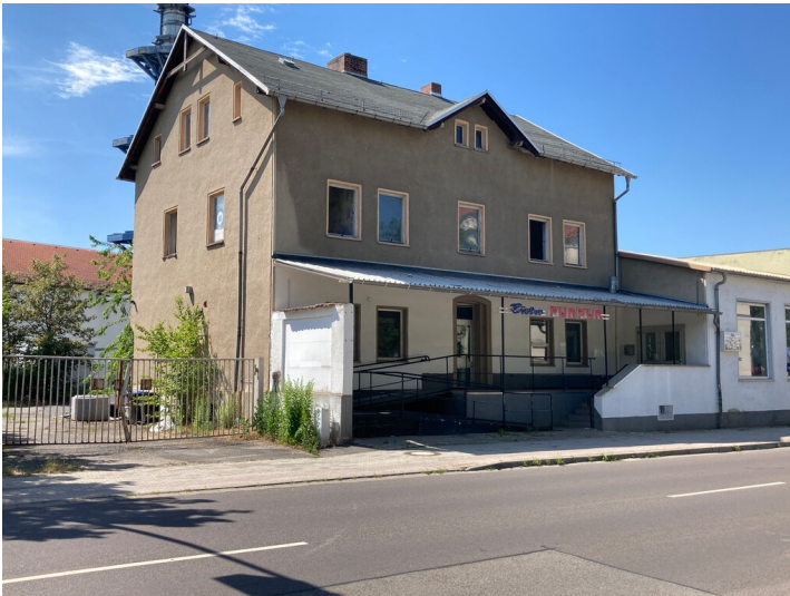
Ehemaliges Kontor- und Wohnhaus der BEUMA, Blick von Südost