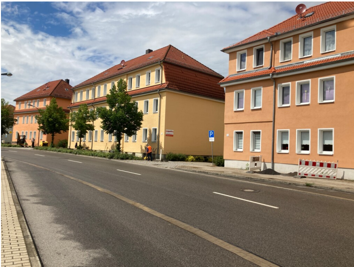
Sechs Mehrfamilienwohnhäuser in drei Baugruppen, Blick von Südosten, vorn Nr. 34