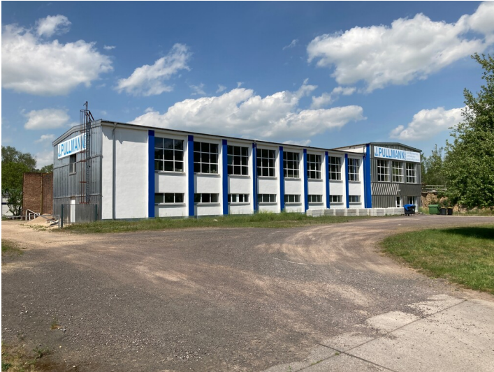
Schaltstation mit Südflügel, Teil der ehemaligen Tagesanlagen, Blick von Südwest