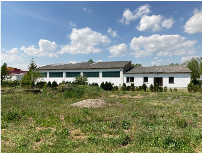
Speisesaal der ehemaligen Tagesanlagen, Blick von Südosten