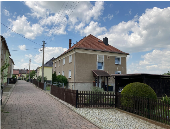
Links die beiden Mehrfamilienhäuser, Blick von Osten