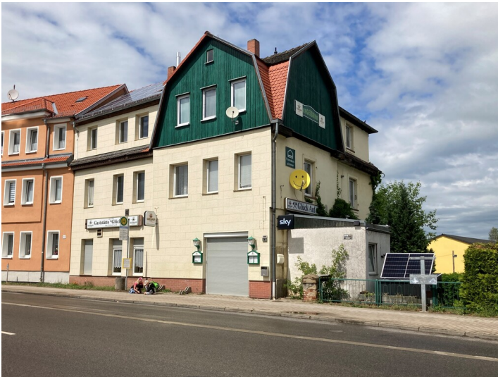
Gaststätte "Glück Auf", Blick von Süden