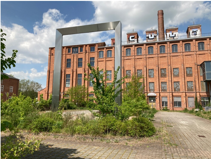
Kunstwerk "terra cultura" vor dem Gebäude der ehemaligen Brikettfabrik Neukirchen, Blick von Süden