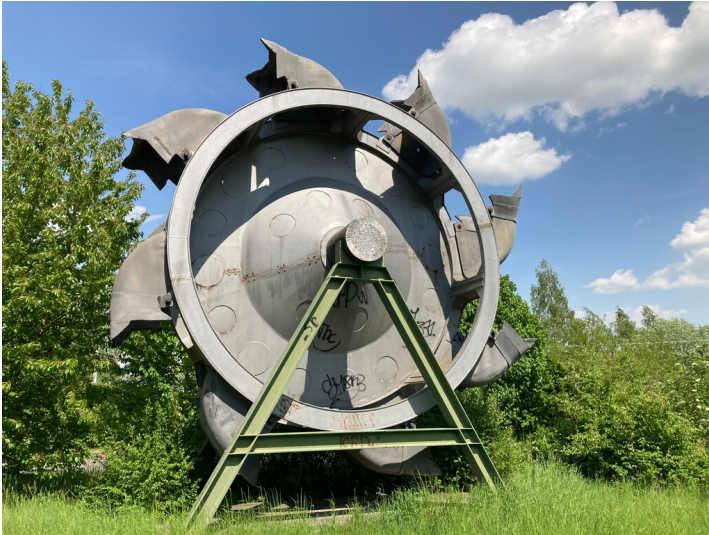
Bagger-schaufelrad, Blick von Südwesten