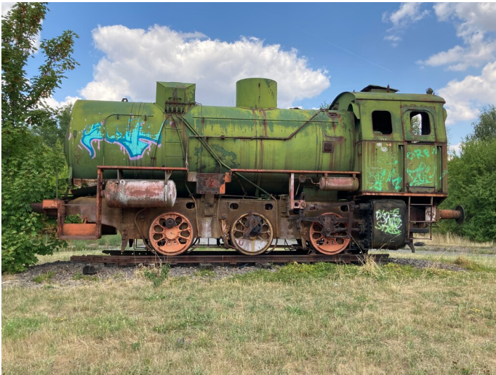
Dampfspeicherlok F 164-50-B3, Blick von Süden