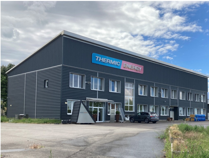
Ehemaliges Rechenzentrum, des Braunkohlenwerkes Borna, Blick von Osten