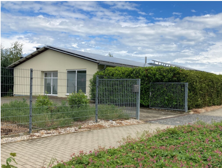
Ehemalige Sozialökonomie des Braunkohlenwerks Borna, Blick von Westen