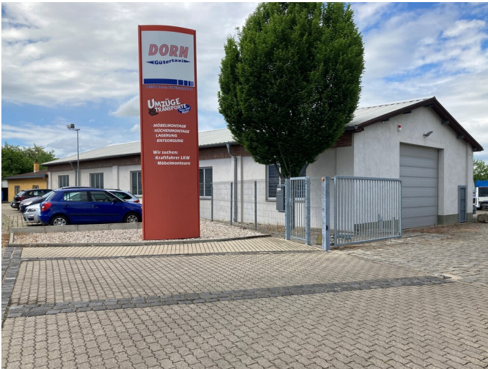
Werkstattgebäude des ehemaligen Braunkohlenwerks Borna (30200046), Blick von Südosten