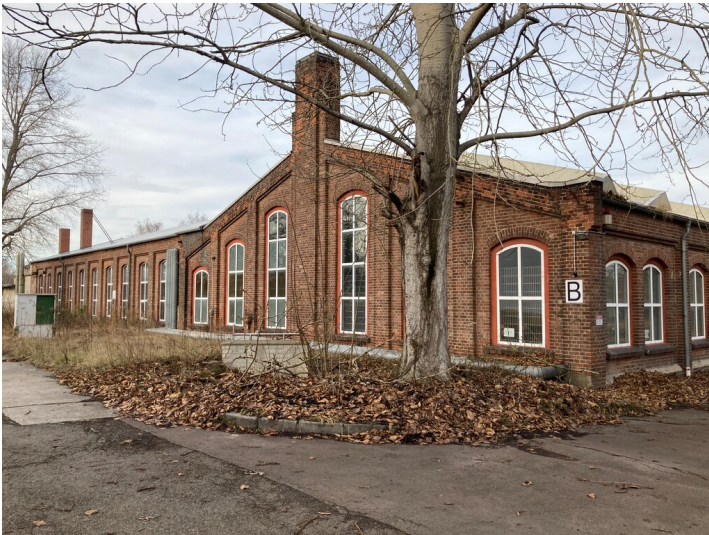
Lehrwerkstatt der ehemaligen Betriebsberufsschule Großzössen, vorn der älteste Teil, dahinter Südflügel mit einstiger Schmiede, Blick von Südosten