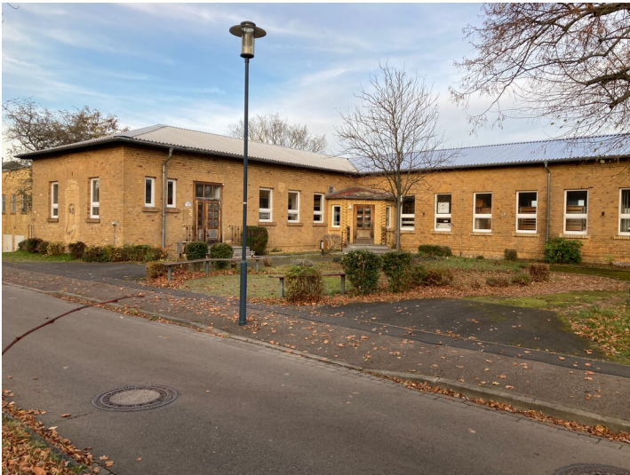
Küche mit Speisesaal der ehemaligen Brikettfabrik Witznitz, Blick von Südwesten

Schlagwörter: Brikettfabrik Fachsicht(en): Denkmalpflege Gemeinde(n): Borna Kreis(e): Leipzig Bundesland: Sachsen