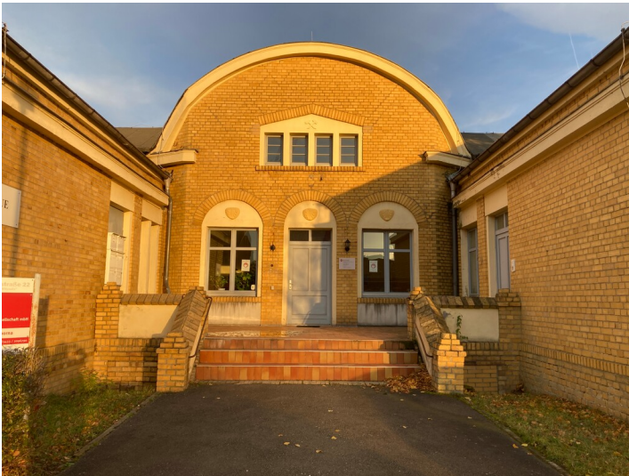
Kaue der ehemaligen Brikettfabrik Witznitz, straßenseitiger Eingangsbereich