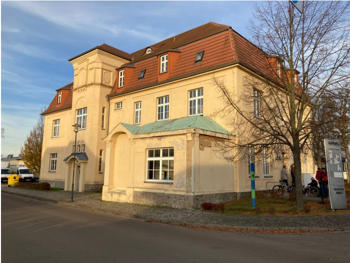
Verwaltungsgebäude der ehemaligen Brikettfabrik Witznitz, Fassade von Südwesten