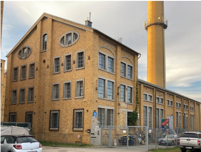
Maschinenhaus der ehemaligen Brikettfabrik Witznitz, Blick von Südost