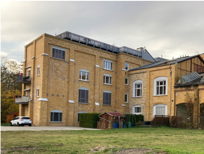
Kühlhaus der ehemaligen Brikettfabrik Witznitz, Blick von Südosten, Pressenhaus rechts anschließend