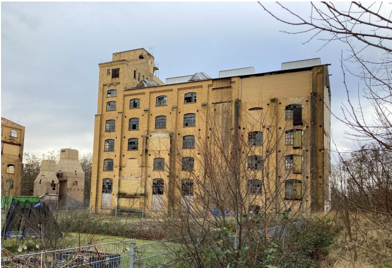
Nassdienstgebäude der ehemaligen Brikettfabrik Witznitz, Blick von Nordost.