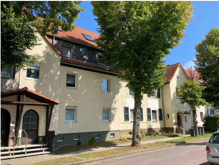
Teil der Siedlung an der ehemaligen Kasernenstraße mit vier Reihenhäuser, Blick von Nordwest.