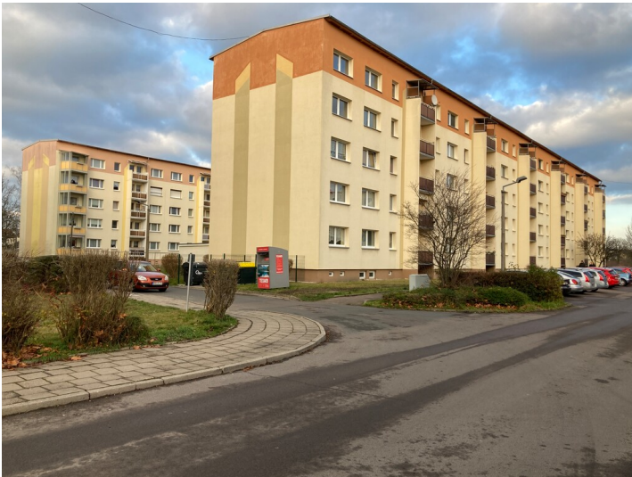
Siedlung An der Wyhra, vorn Wohnblock Hausnr. 19 bis 24, Blick von Südwest