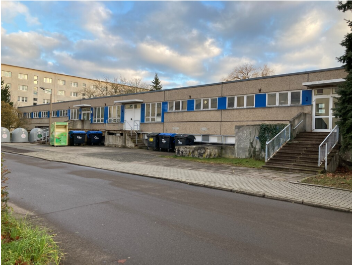
Siedlung An der Wyhra, ehemalige Kinderkombination, Nordtrakt, straßenseitiger Blick von Nordwest