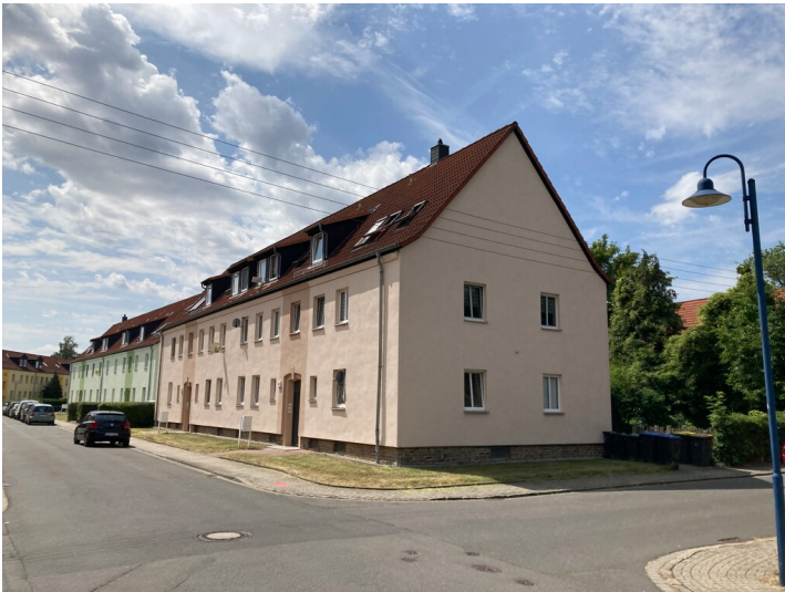
Siedlungsteil, bestehend aus traufständigem Wohnhaus, Blick nach Südwest in die Mozartstraße