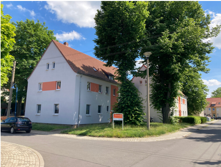
Siedlungsteil, bestehend aus einem stadträumlich versetzt angeordneten traufständigen Doppelhauses, Eckansicht nach Südost