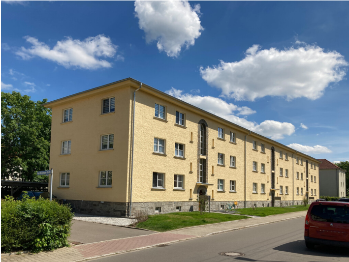
Mehrfamilienwohnhaus (mit drei Eingängen) in offener Bebauung, Schrägansicht nach Südost