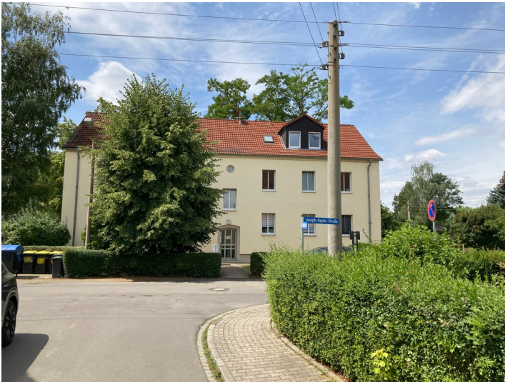
Sechsfamilienwohnhaus Joseph-Haydn-Straße 20, Blick nach Südwest