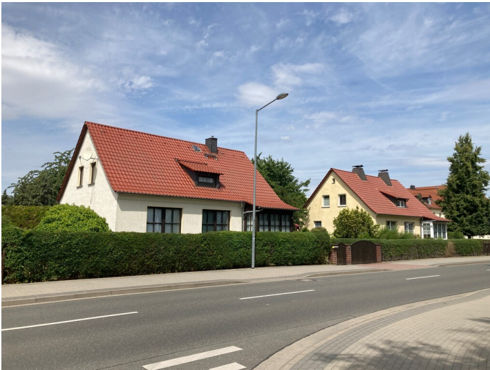
Eigenheime für die schaffende Intelligenz, Blick nach Nordwest in die Leipziger Straße