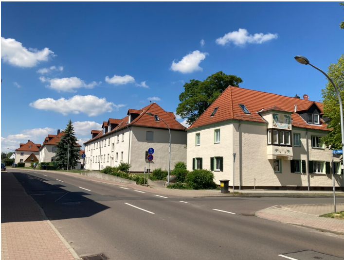
Siedlungsteil, bestehend aus vier Wohnblöcken mit insgesamt sieben Vierfamilienhäusern, Blick nach Norden in die Karl-Marx-Straße