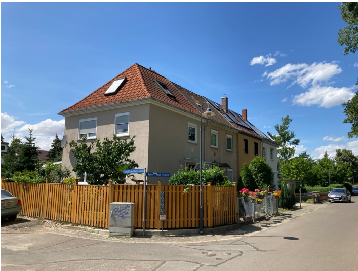
Siedlungsteil, bestehend aus zwei Zeilen mit vier Reihenhäusern, Blick nach Westen