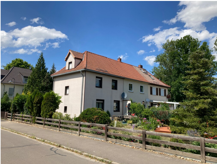
Siedlungsteil, bestehend aus fünf Zeilen mit je drei Reihenhäusern, Blick nach Norden