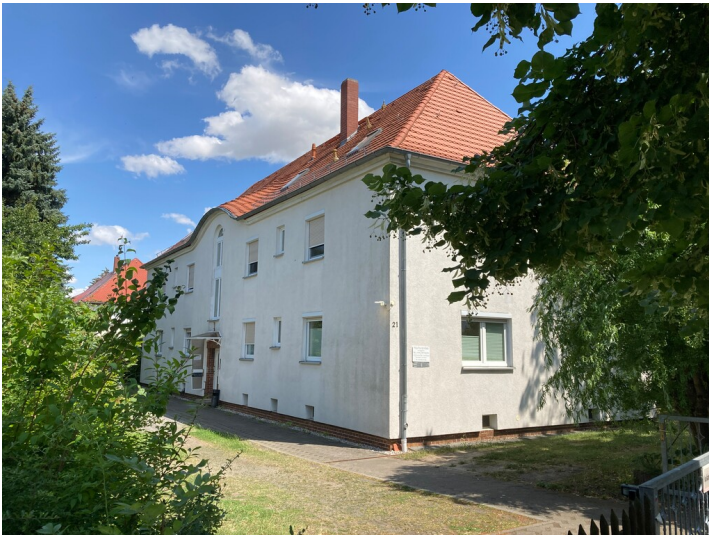
Siedlungsteil, bestehend aus zwei Mehrfamilienwohnhäusern, Blick nach Osten