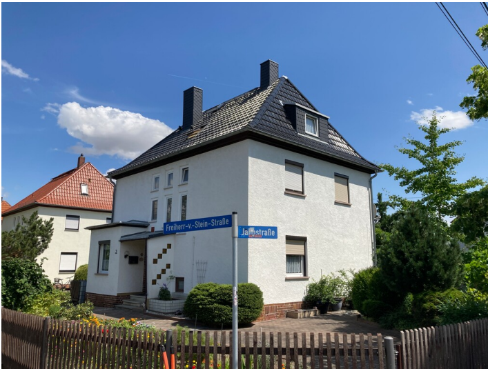
Siedlungsteil, bestehend aus vier Einfamilienwohnhäusern, Blick nach Osten