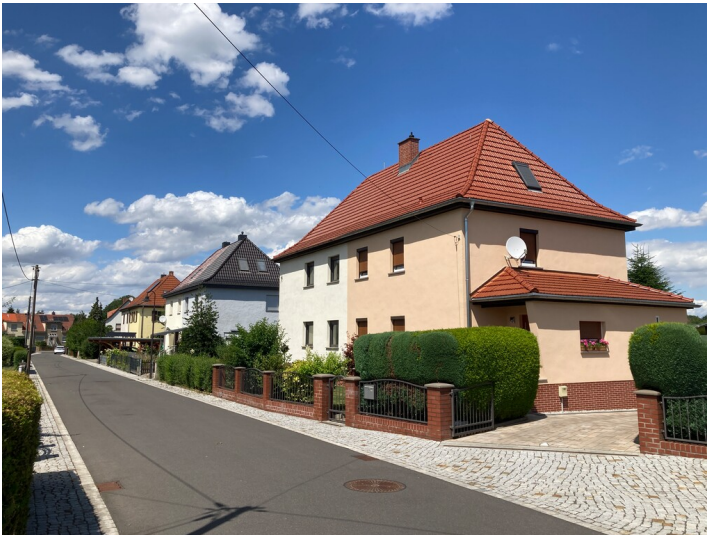
Siedlungsteil, bestehend aus sieben Doppelwohnhäusern, Blick nach Norden