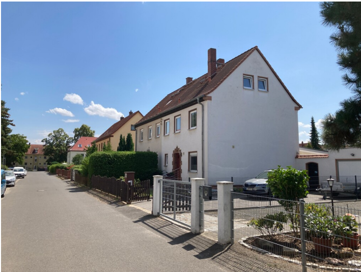
Siedlungsteil, bestehend aus zwölf Doppelwohnhäusern mit Garage, Schrägansicht